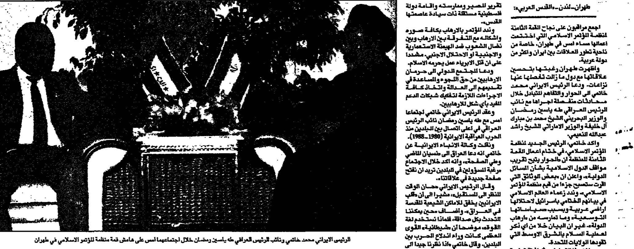
الرئيس الإيراني محمد خاتمي و نائب الرئيس العراقي علي ياسين رمضان خلال اجتماعهما أمس على هامش قمة منظمة المؤتمر الإسلامي في طهران.